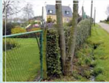
Haie d'Elaeagnus... sous contrôle...

Évitez les engrais azotés, qui la rendraient plus vigoureuse.