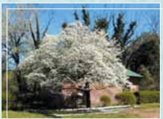
Cornouiller au printemps

Les floraisons sont souvent spectaculaires. En hiver, les branches dépouillées de feuilles gardent un aspect esthétique et laissent passer plus de lumière.