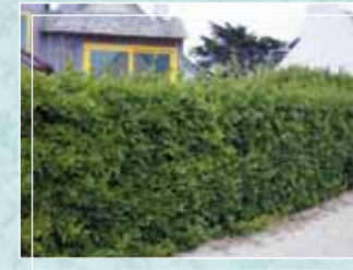
Fusain du Japon Adapté au bord de mer, à l'ombre, au soleil, aux sols ingrats.

Certaines espèces se limitent naturellement à une hauteur de 2 à 3 m.