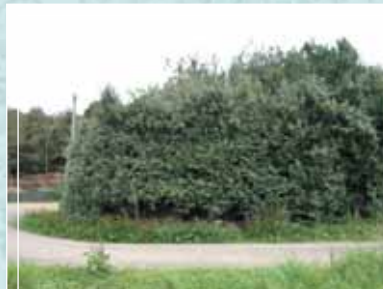
... et en plant non taillé. Hauteur 7 m.

Ou laissez-la pousser en haie libre... ... si votre jardin le permet.