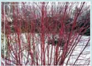
Cornouiller en hiver