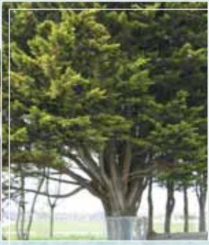
... et à l'état naturel. Hauteur 20 m. Branches et tronc épais.