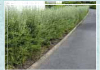
Olearia Virgata Pousse rapide. Bonne résistance aux embruns.

Un laurier palme peut rapidement faire 1.50 m de large. Pour un jardin étroit, préférez les espèces poussant peu en largeur.