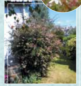
Abelia Grandiflora Pousse rapide. Petites feuilles caduques. Fleurs blanches à blanc rosé.