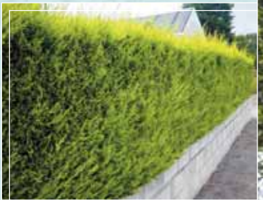
Cyprès Sous forme de haie taillée...

Les rameaux deviennent des branches épaisses. Le sécateur laisse la place au taille-haie, puis à la tronçonneuse.